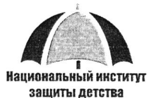
График образовательных мероприятий Национального института защиты детства на 2018 год